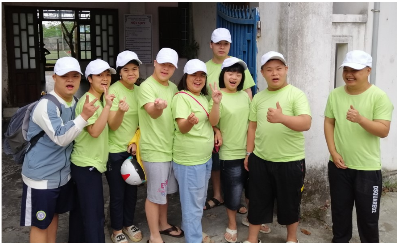
Départ pour l'examen

Puis est venu le jour de l'examen, et là encore plus de sérieux et de stress !