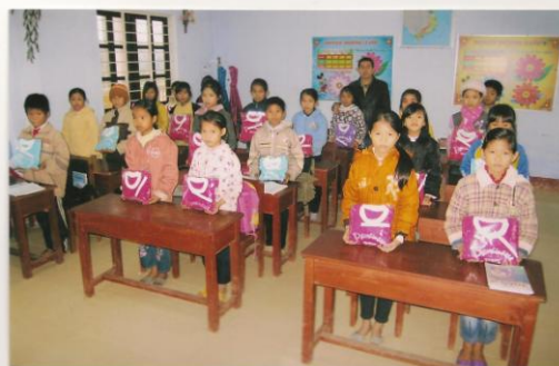
en CM2 à l'école primaire