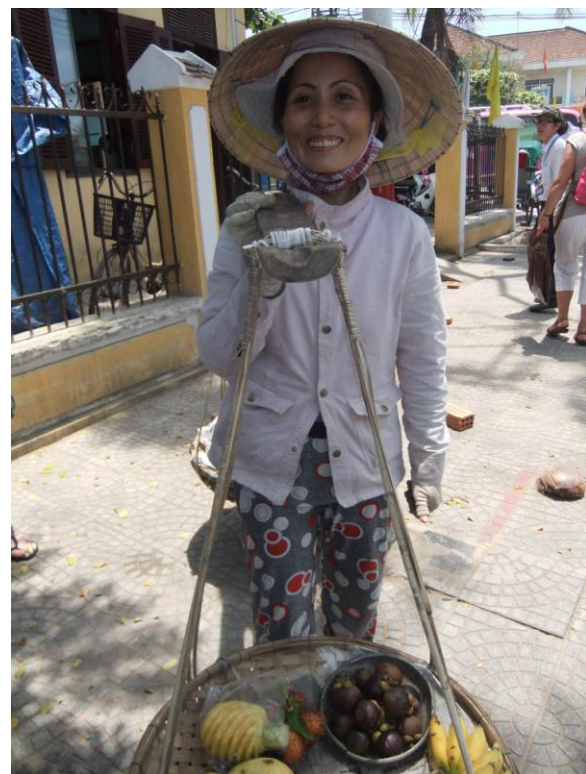
Un joli sourire