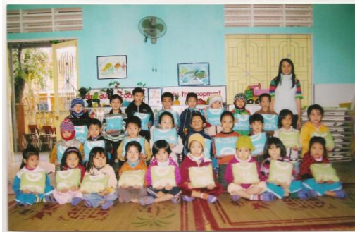
en grande section de maternelle

Quelques photos des remises de ces vêtements.