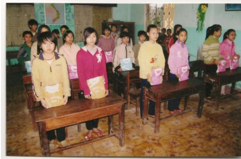
en 4 ème au collège