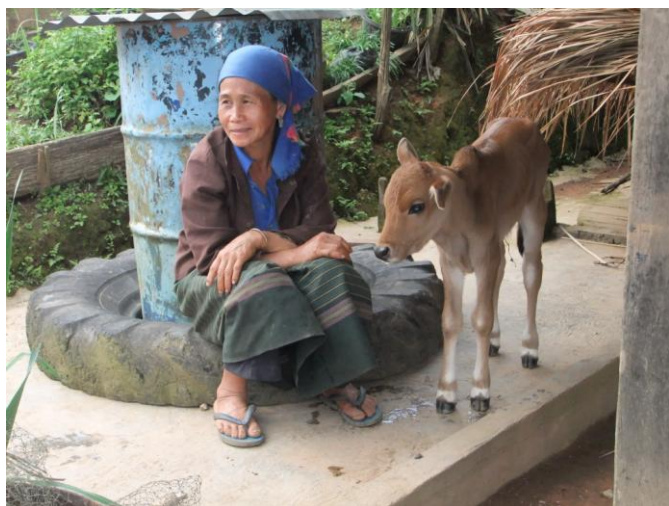
Dans un village H'Mong