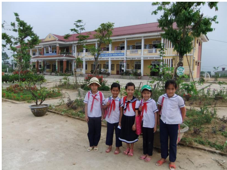
sortant de la nouvelle école primaire de Kim Long